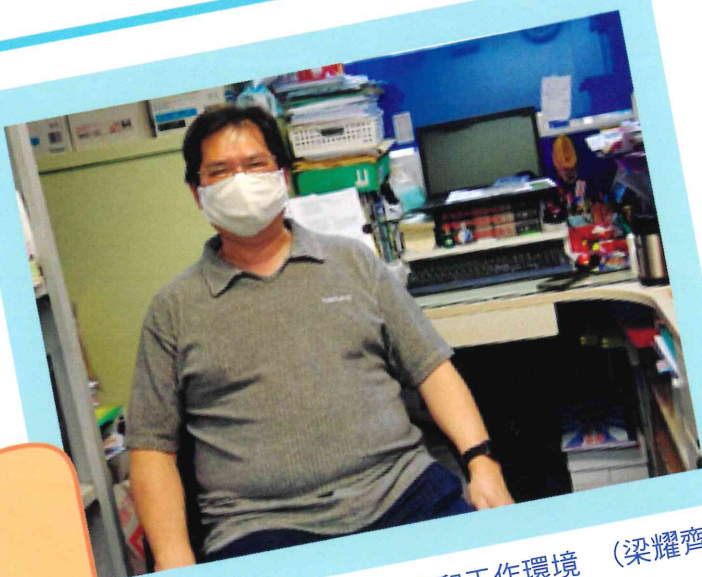
阮老師的辦公室和工作環境

採訪：4H楊善盈 4H翁紫璇 記錄：4D馬逸安 4H任一諾 攝影及撰文：4H梁耀齊