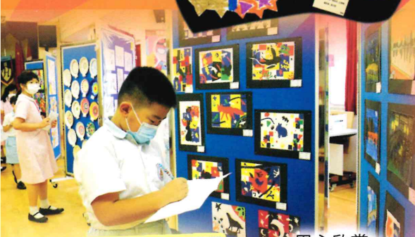
用心欣賞，值得讚賞