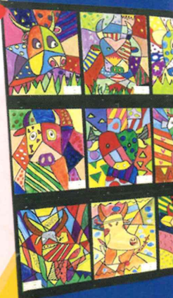
同學們認真投選最喜愛的作品

本年度的視覺藝術展已於16/6至17/6順利舉行，展出了一至六年級的優秀作品給全校師生欣賞。作品多元化，且極具質素，同學們有秩序地逐班到禮堂欣賞畫展，更認真地進行網上投票，投選各自心目中最優秀的作品。這些都是田小同學在視藝課裏用心創作的藝術品！