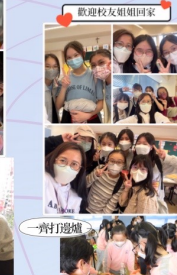
歡迎校友姐姐回家