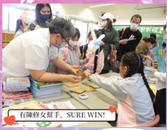
有陳修女幫手, SURE WIN!