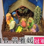
冠軍 1B 黃雅媛 冠軍