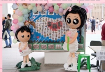
聖羅撒大家庭歡迎你!