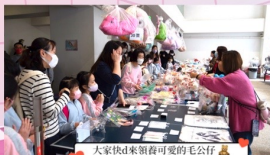
大家快d來領養可愛的毛公仔