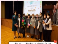
校長、校友及嘉賓合照