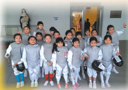
終於到丙組出場了，我們必定全力以赴