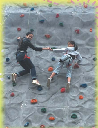
「親子挑戰」成功，多麼溫馨！