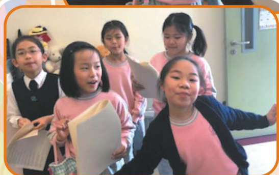
D.3 students rehearsing in the English Room

English Corner runs daily and it has a flexible choice of activities in which all students can engage in. The main purpose is to make it fun and relaxing where students can learn to speak English in a supportive and positive environment. This year, students participated in singing. Some students selected their own songs and band name. They performed the famous Let It Be by the Beatles and Rainbow by Sia.