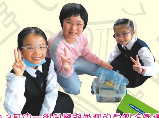
D.3 其中一組同學與她們的自製冷氣機。