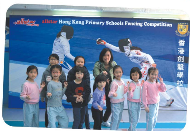
梁老師也到場為同學打打氣