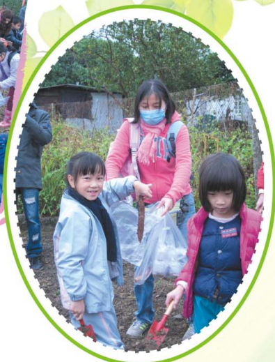
你們看看，我成功掘到蕃薯了！