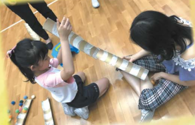
家長和學生一同製作賽道，準備對戰啊！