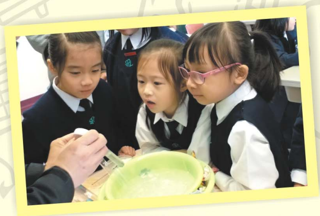
同學們主動積極進行科學探究。