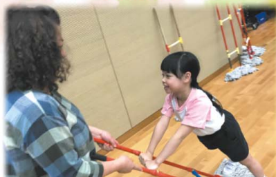
雪橇地拖這個小玩意很受歡迎呢！