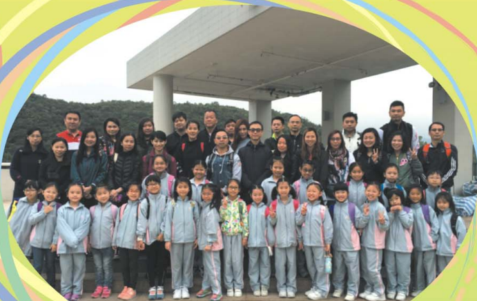
活動前來一張大合照-「笑」！