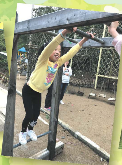
這個設施真好玩呀！