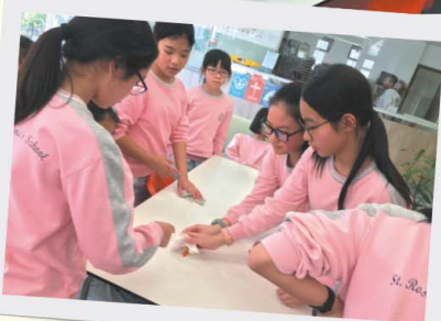
大家分工合作，清潔飯堂吧！