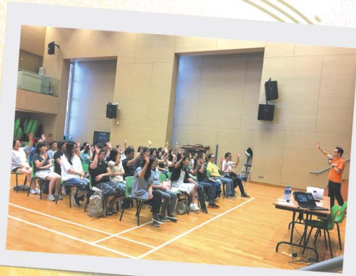
家長們很投入，積極學習！