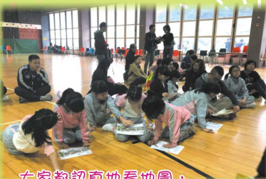
大家都認真地看地圖，準備找出「遊戲密碼」