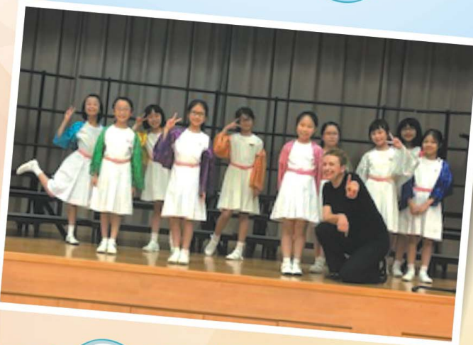
"The Galaxy Girls" performing on stage