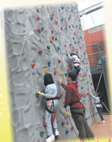
大家一起向上攀，很勇敢！