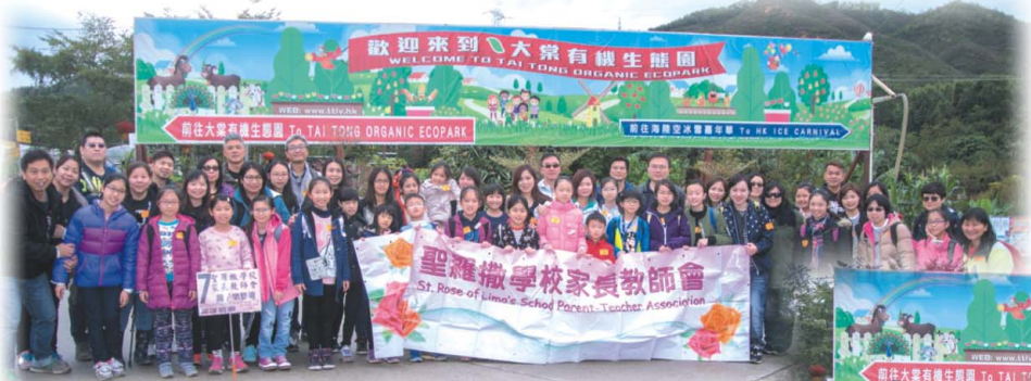
5號車及7號車大合照，大家都笑得很燦爛喇！