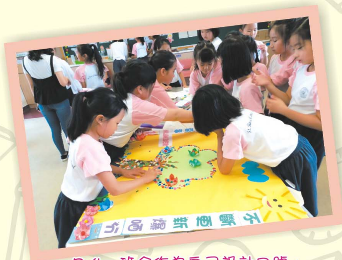
D.4 一班合作為自己設計口號。