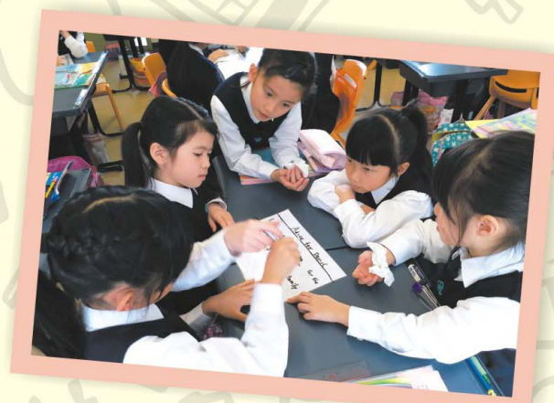
D.2 同學在英文課堂中學習何謂「雙贏」思維。