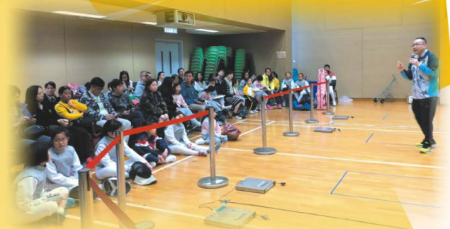
比賽前，教練作比賽規則講解，大家留心聆聽

2018年3月16日，本校首次舉辦了一場劍擊友誼賽，邀請了17位友校同學，跟本校34位同學進行劍擊比賽，互相切磋劍技。當天同學們表現得相當投入，比賽競爭激烈，觀眾亦非常投入。最後我校和友校的同學各有勝負，贏得掌聲和友誼。