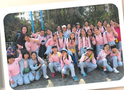
三天的營期結束，我們回家前，先來個大合照吧！