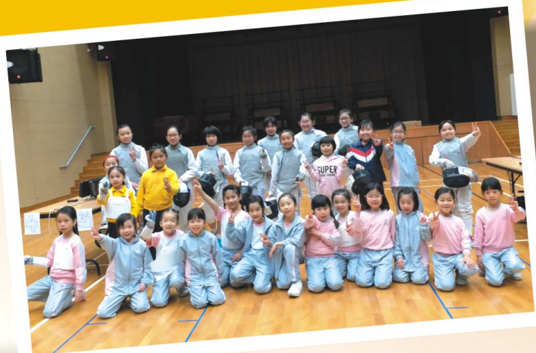
甲組、乙組和新秀組的同學在比賽前先來一張大合照