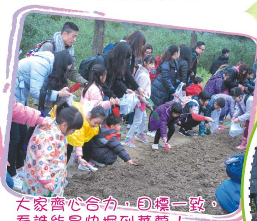
大家齊心合力，目標一致，看誰能最快掘到蕃薯！