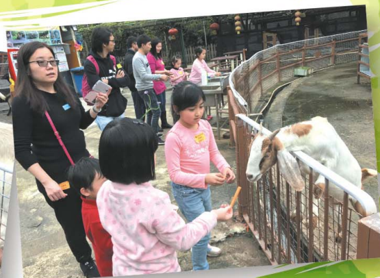
這裡的動物多可愛，我們都不想離開呢！