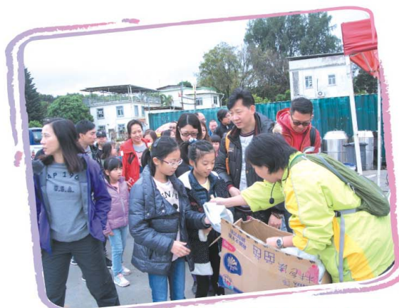
大家準備出發到農田掘蕃薯喇！

大約下午四時半便結束了親子之旅，大家都帶着滿足踏上歸程，希望來年的「親子樂悠遊」能再跟你們見面！