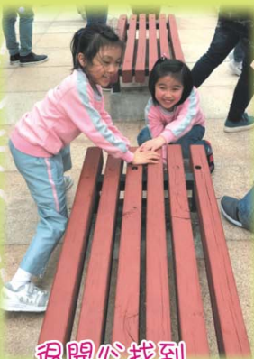
很开心找到「遊戲密碼」，如獲寶藏。