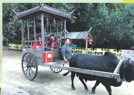
看！我們乘坐牛車，真有趣啊！