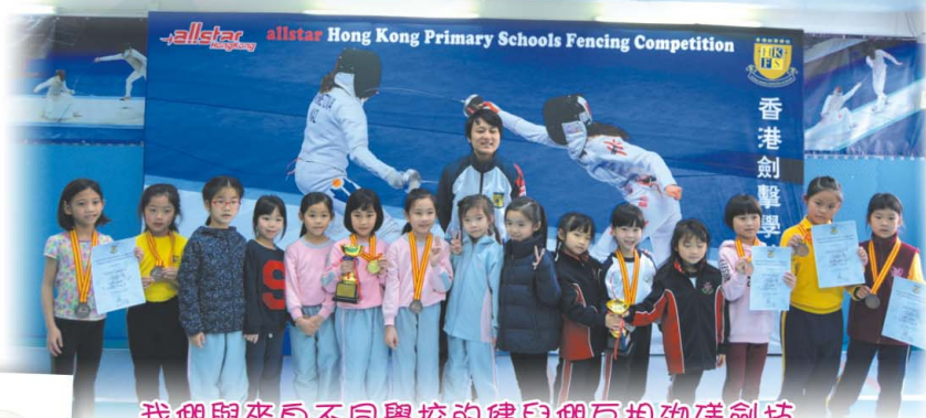
我們與來自不同學校的健兒們互相切磋劍技

2018年3月11日，16位小一至小二的同學參加了「Allstar 小學校際劍擊新秀賽 2018」，雖然她們都是劍擊的初學者，但都能在比賽中全力以赴，爭取佳績，從比賽中得到寶貴的經驗，我們更在女子丙組及丁組團體賽中奪得冠軍呢！