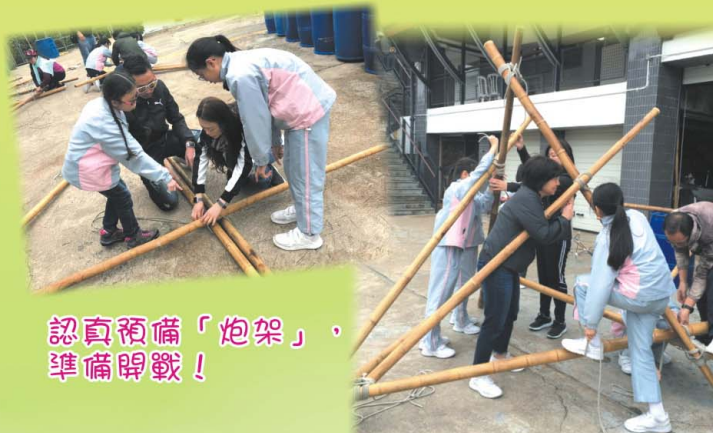
認真預備「炮架」，準備開戰！