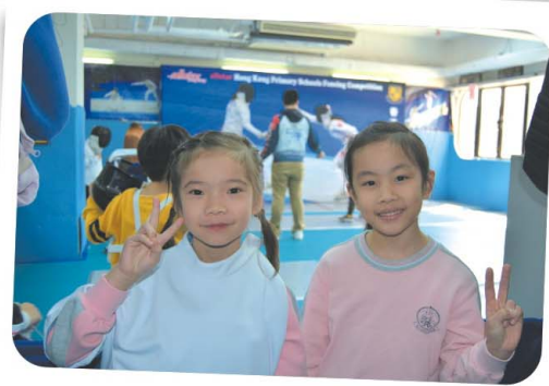
比賽之餘，更贏得友誼