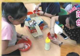
落手落腳，共同製作色彩繽紛的鹽沙樽