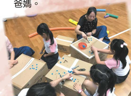
原來我們可以利用紙皮箱創作不同的遊戲啊！

參加上述遊戲講座後，家長學懂了一些遊戲秘技，便隨即把剛才工作坊所學到的技巧實踐出來，嘗試跟孩子玩遊戲，學習當個好玩又讓孩子感到被愛的爸媽。