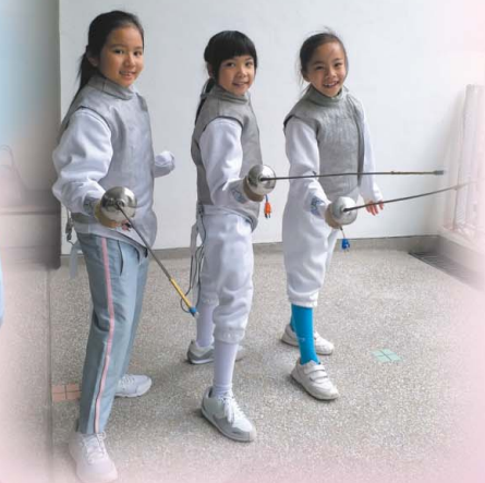
「友誼第一，比賽第二」是這次比賽的真諦