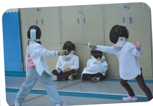
看看我們的比賽英姿