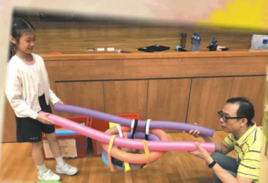
你們看，他們利用習泳棒做了甚麼東西？