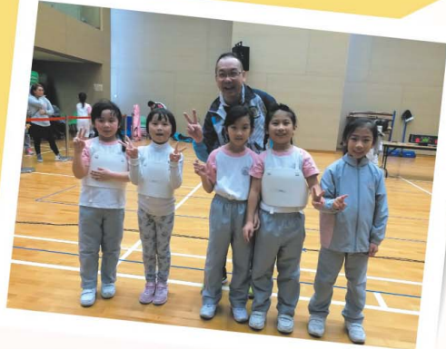
作戰到最後，我們在新秀組比賽勝出了