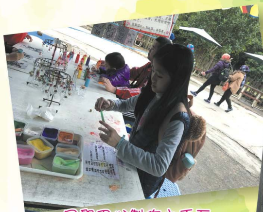
同學用心製作小手互， 製作得很精美。