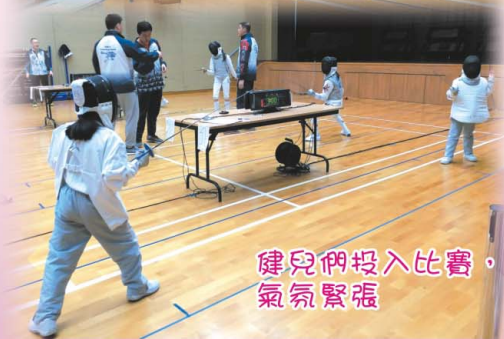
健兒們投入比賽，氣氛緊張