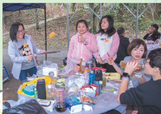
開餐了，燒烤的食物真美味啊！