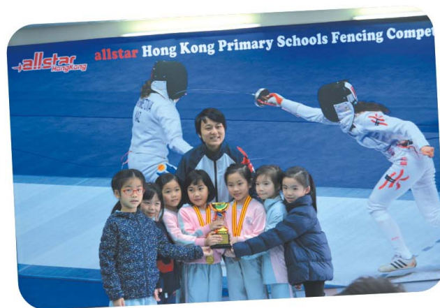
這是我校出戰女子丁組比賽的小健將