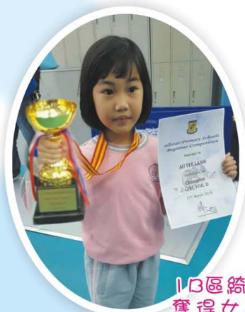
1B區綺嵐同學 奪得女子丁組 個人冠軍