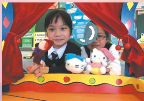
D.2 students engaging in mini theatre