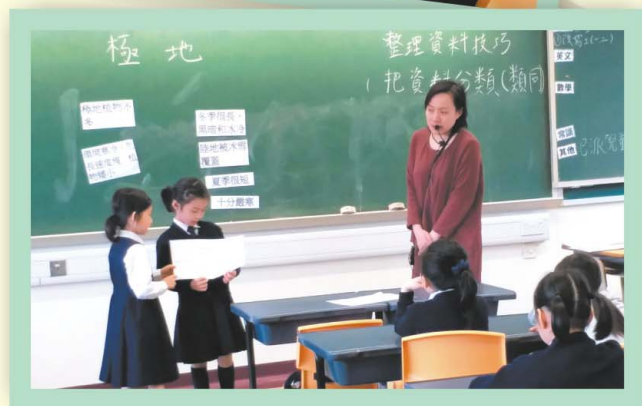
透過教研(共備、試教、觀課及討論)，老師積極優化課堂設計來幫助同學明白七個好習慣及掌握各種自學技巧。