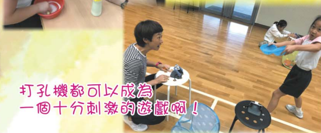
打孔機都可以成為一個十分刺激的遊戲啊！