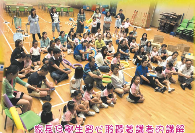
家長及學生留心聆聽著講者的講解