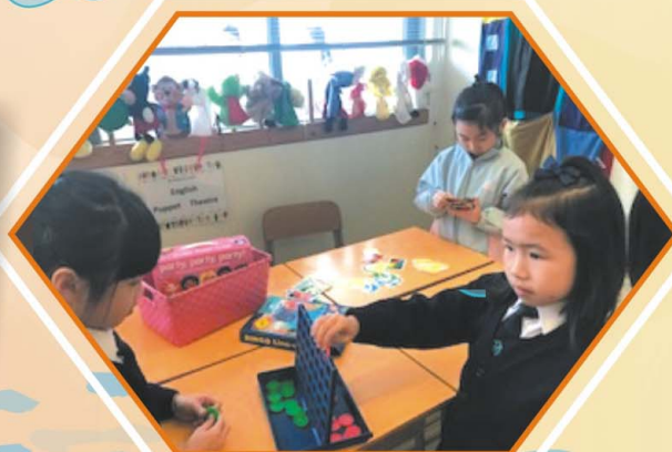
Students playing a variety of games