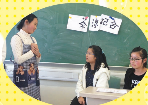
以話劇創作展示所知