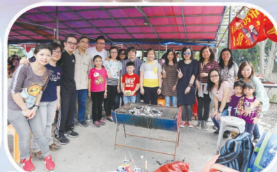
大家一邊燒烤，一邊談天，多開心啊！