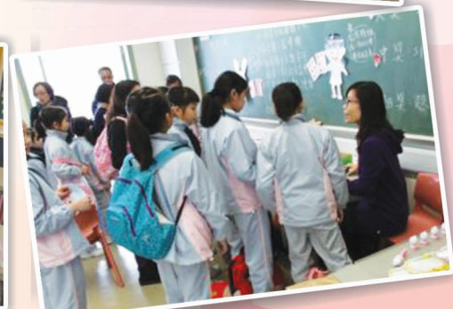
老師製作的攤位也很受歡迎，同學們玩得多開心！