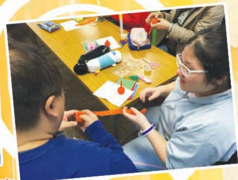
你們看！家長和同學們真的很認真。