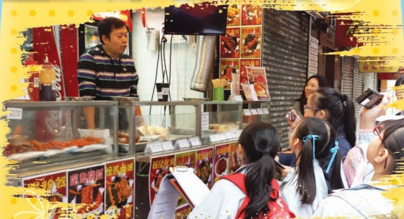
訪問店鋪老板・學習與人溝通