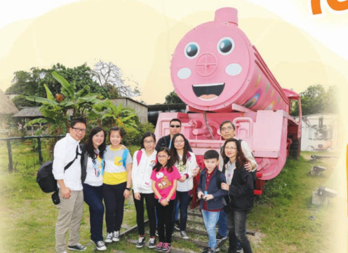
火車的造型真可愛呀！