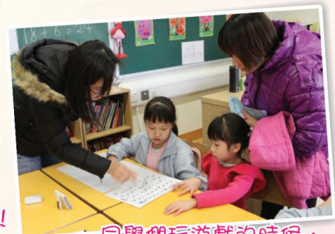
同學們玩遊戲的時候， 又積極又投入！