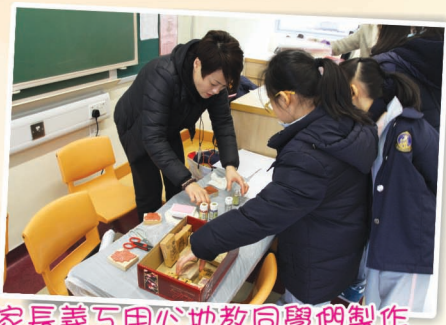
家長義互用心地教同學們製作 小手互，抵讚！