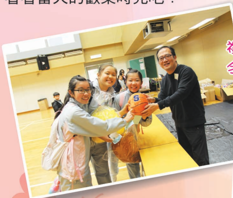
禮堂裏有很多禮物， 令人看得眼花繚亂！