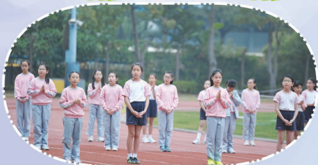
比賽開始前，運動員先誠心祈禱。

本校第十五屆運動會於二零一五年二月十七日(星期五)在九龍深水埗運動場順利舉行。當天運動場上都是一張張充滿陽光朝氣的臉孔，同學們精神抖擻，本著勝不驕、敗不餒的體育精神進行各項比賽。