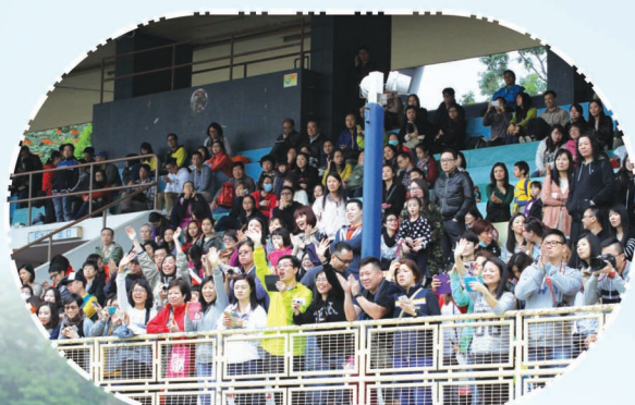
家長們看得很投入呢！