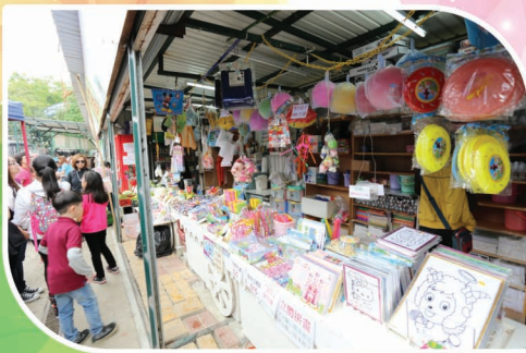
農莊裏有不同紀念品或小食攤檔，很熱鬧。