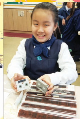
歷史在我的「家傳之寶」中