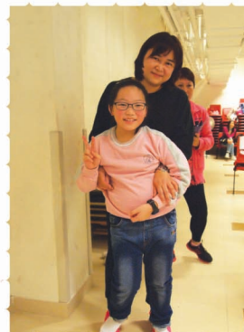
可以和家人一起活動，真的很開心。