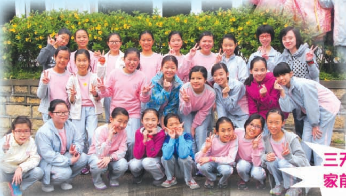
三天的營期結束，我們回家前，先來個大合照吧！