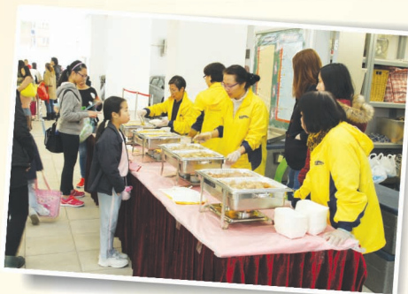
你們看，小食部的食物款式真多！