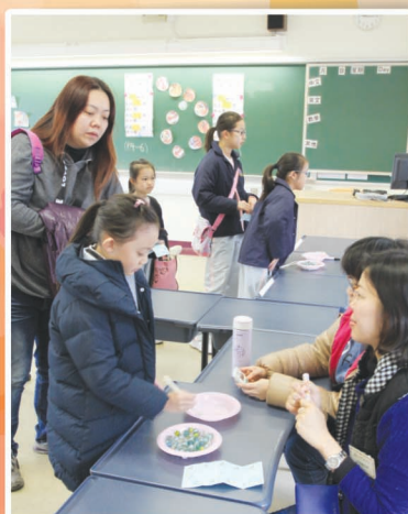
夾波子難度高，很好玩呢！