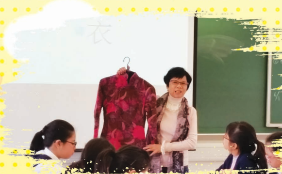
從觀察舊物中認識過去