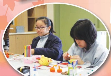
同學們用心地製作小手互， 相當認真！