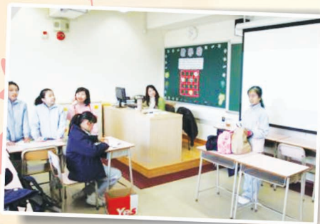
我們很快便猜中答案，多厲害啊！