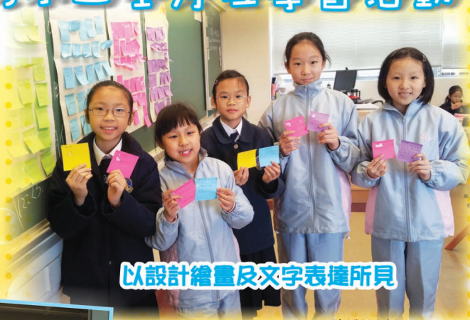
以設計繪畫及文字表達所見