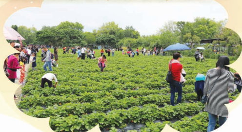
家長、同學們在摘香甜的士多啤梨。

很多謝各位家長對本會的支持，同時也要多謝家教會內各委員、老師及義工付出的努力，才能夠使活動圓滿地完成。希望來年家教會能策劃更多精采的活動給大家！