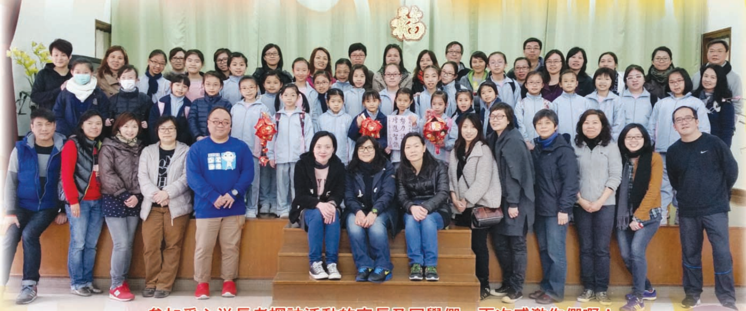
參加愛心送長者探訪活動的家長及同學們，再次感激你們啊！