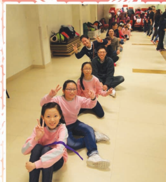
Yeah! 我們都玩得很開心呀!

在3月15日，訓輔組舉行了「親子樂繽紛Fun」活動，以歷奇活動的形式加強親子間的溝通和協作。