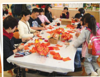
我們利用利是封製作不同的賀年飾品啊！