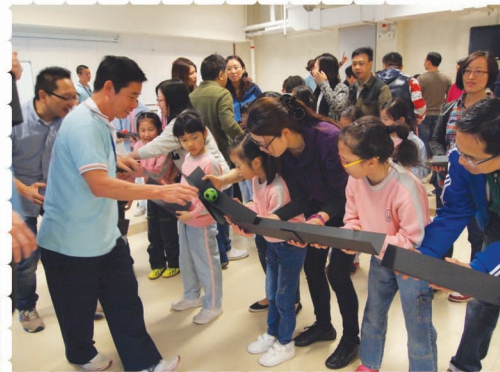
看清楚，慢慢來，水管傳球要專心。