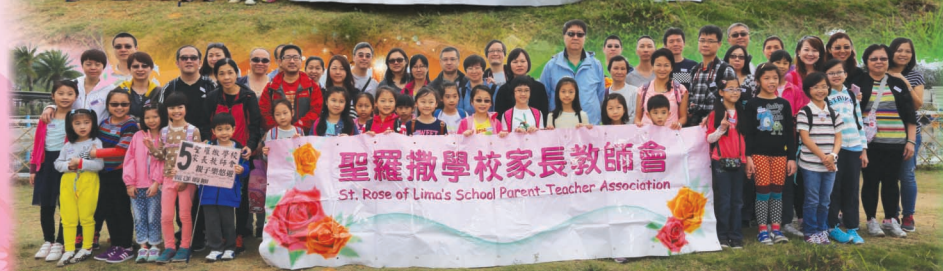
1號、3號及5號車老師、家長、學生們大合照