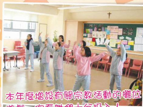
本年度增設有關宗教活動的攤位 遊戲，你看她們十分投入！