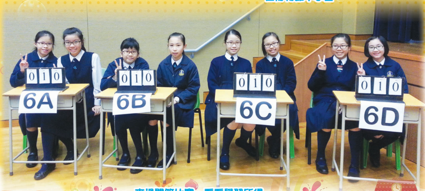
來過問答比賽，看看學習所得