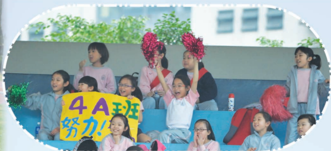
啦啦隊努力為運動員打氣。