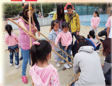
緊實啲，令個炮架穩陣啲，射得準啲。