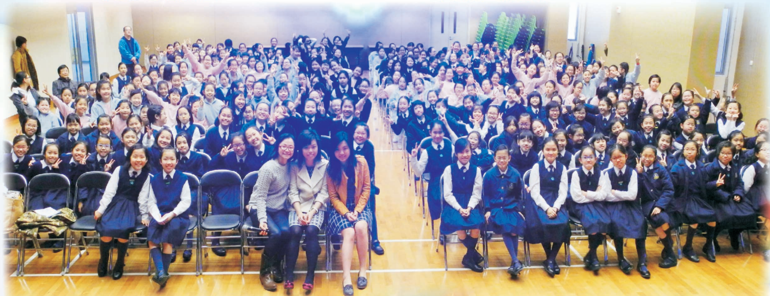
姐姐，我們會銘記於心！