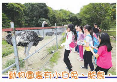
動物園裏有小白兔、駝鳥，同學們爭着餵動物啊！