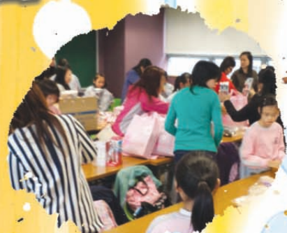
探訪活動前，家長及同學們落力地為長者製作小手工及準備福袋的禮物啊！

這次活動對同學們來說是一個十分難得的經驗，日後本會會舉辦多些有意義的活動，希望各家長及同學們踴躍參與，令同學成為一個友愛、關懷和幫助別人的好學生。