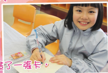
我親手畫了一張卡， 大家認為如何呀？