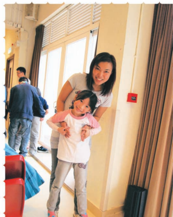
很期待遊戲快些開始呀!