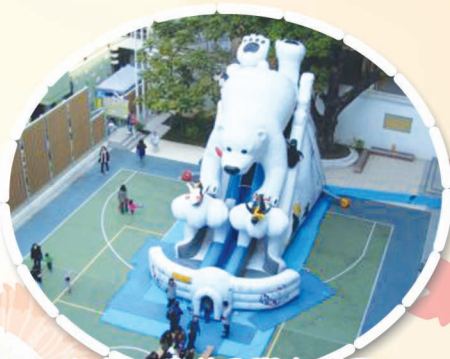
操場上的吹氣滑梯及彈床總是 最受同學們歡迎的遊戲啊！